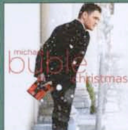
Michael Bublé CHRISTMAS Warner Bros, 2011

Spiace ripetersi. Ma ubi maior... Se l'anno scorso vi consigliavamo una colonna sonora perfetta per le feste, come accompagnamento ideale a una cioccolata calda sorseggiata sotto l'albero, la Hollywood Edition di Crazy Love, quest'anno ad un mese dal Natale, Michael Bublé si supera, uscendo con una furbetta operazione total Christmas anticipata dal singolo "Cold december night". Un regalo che piacerà a molti e che lo consacra una sorta di simbolo delle feste, un po' Sinatra un po' Babbo Natale. Agli amanti della classica - perdonate il gioco di parole - proponiamo un classico senza pari: un omaggio deluxe a Beethoven, perfetto da impacchettare e nascondere sotto l'albero Sinfonie complete, orchestrate dalla Gewandhaus Orchester di Lipsia, diretta da Riccardo Chailly.