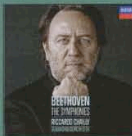
Ludwig van Beethoven SINFONIE COMPLETE - OVERTURES Decca, 2011